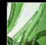
08 Verde Green