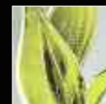
06 Giallo Yellow