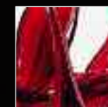
04 Rosso Red