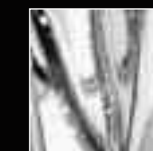
10 Trasparente Transparent