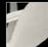
12 Bianco White