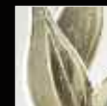
09 Fumé Smoke