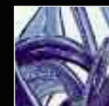
07 Bluino Light Blue