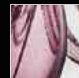
19 Violetto Violet