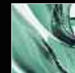
14 Turchese Turquoise