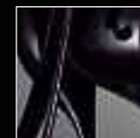
11 Nero Black