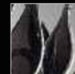
15 Grigio Gray